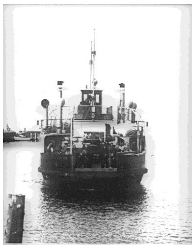
Den første færge "Korshage"

I 1928 startede brødrene A/S Korshage, der skulle drive Hundested-Rørvig færgefart med den nybyggede motorfærge "Korshage", og så begyndte der at komme gang i trafikken i sommerhalvåret, idet færgen ikke sejlede om vinteren.