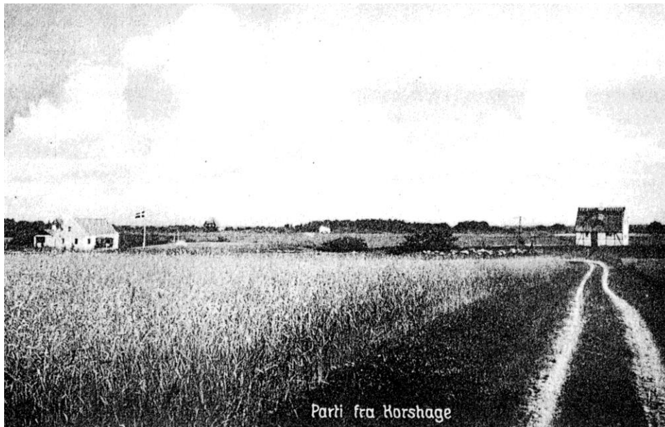
Korshagevej med det gl. Gyvelbo t.v. og Fjordglimt i horisonten og Bjønvijs hus t.h.

Det var en helt anden natur, end den vi ser i dag, hvor skovene er blevet store og høje, og mange grunde er meget tilgroet.