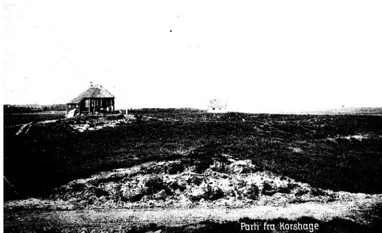
Parti fra Korshage Korshagehus og Børnenes hus set fra Øst.